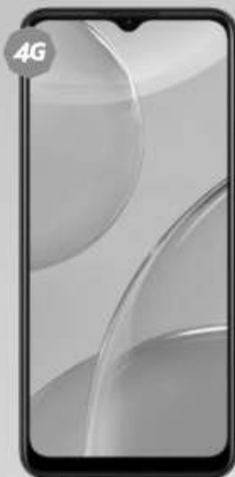
OPPO | A15 A: $4,139 1