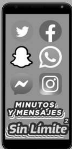
KODAK | KD50 A: $1,499 1