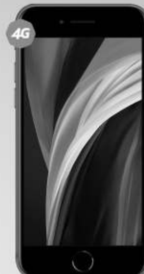
iPhone | SE 64GB A: $10,999 1

Telcel la mejor Red con la mayor Cobertura