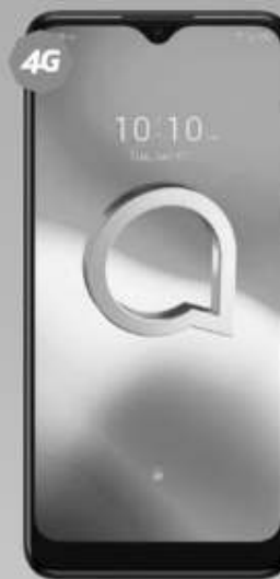
ALCATEL | 5030A 1SE 64GB A: $3,249 1