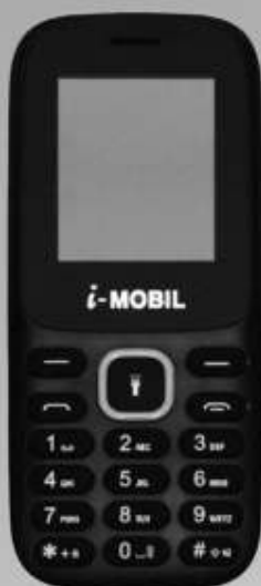
i MOBIL | IM220 A: $329 1