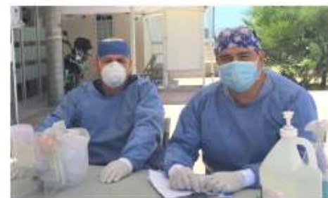
colonia La Gloria, Santa Fe, El Tecolote, entre otras comunidades de Tijuana, ya que tienen cercanía a dicha clínica.

La doctora reiteró que la Clínica atiende a toda persona que tenga o no alguna derechohabencia a cualquier institución médica, así también atiende a residentes de la periferia como de la