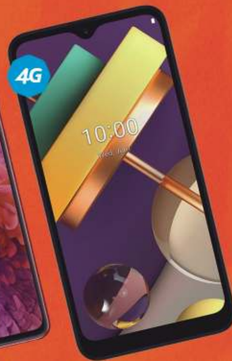
LG K22+ $3,789