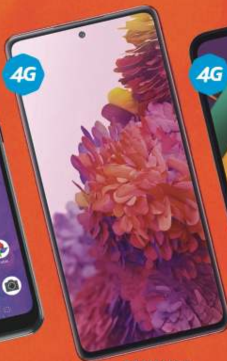
SAMSUNG Galaxy S20 FE 128GB $16,999