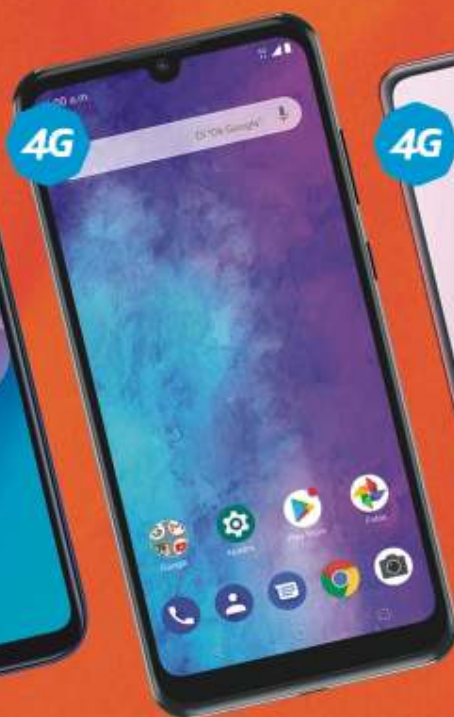
ZTE A5 2020 $2,899