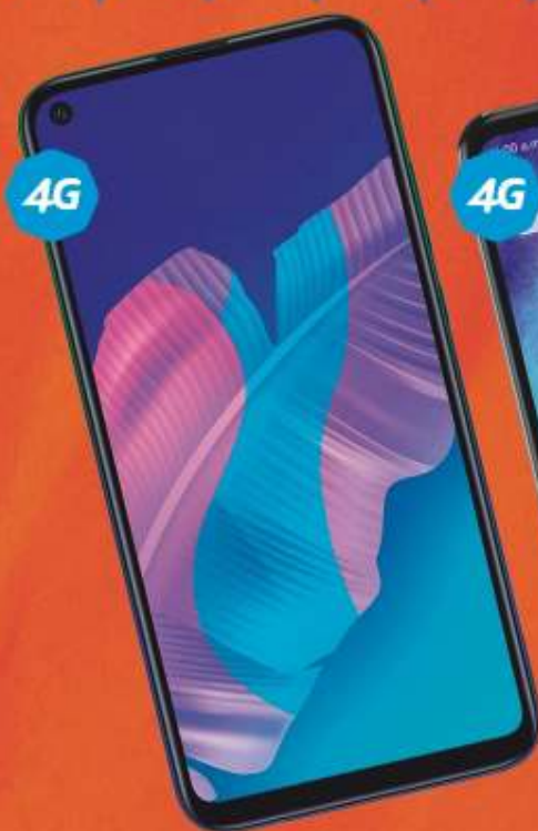
HUAWEI Y7A $5,799