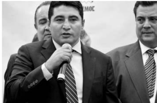
Erick Morales Elvira, Presidente de la Comisión del Deporte del Congreso de la Unión.

Sin embargo, aclaró que los fondos ahorrados por los deportistas no se han tocado y se les regresarán una vez definidas las formas. Por lo que respecta a la desaparición del programa de ahorro para el retiro de los atletas de alto rendimiento incluyendo paralímpicos, adelantó que se están buscando las formas legales que permita