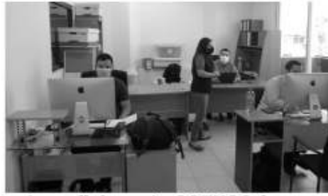
Las oficinas de COTUCO fueron reubicadas temporalmente junto a la Presidencia Municipal.

Aunque las autoridades justifican que la reubicación será temporal, en tanto se construye la nueva sede propia en el edificio multifuncional que estará ubicado en la antigua comandancia de la zona centro, la realidad está dejando muchas dudas a los representantes del sector turístico.