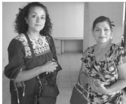
Las representantes vecinales demandaron la regularización de Terrazas del Mar.