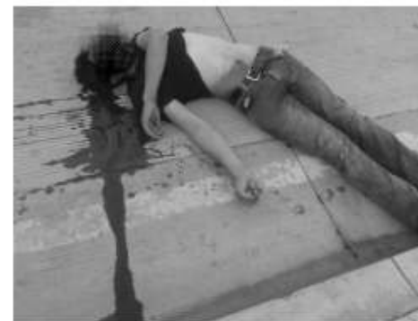
El hombre asesinado en el bulevar Hisense.

Vecinos lo recuerdan como un joven crecido en Rosarito, cuyos padres aún se congregan en la iglesia cristiana a la