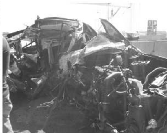
Así quedo el automovil

"Juanitos". Tan fuerte fue el impacto, que la camioneta prácticamente se despedazó, siendo esta una Tahoe color negra modelo 2012. Milagrosamente, el único espacio que no se aplastó fue el área del conductor, siendo rescatado por trabajadores de grúas Salceda y otros voluntarios que se acercaron para ayudar.