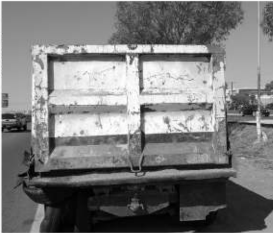
Contra este camión choco el automilista