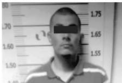
Cristóbal N fue sentenciado a 5 años de cárcel por robo de vehículo.