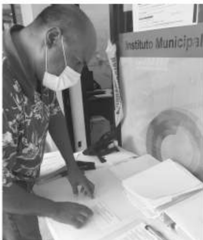
Chávez Magaña. Si el cabildo aprueba tal partida la

Los afectados son familias vulnerables que preparan alimentos o manualidades en sus viviendas y salen a las calles a venderlos, son más de mil personas que se han acercado a la dirección, indicó