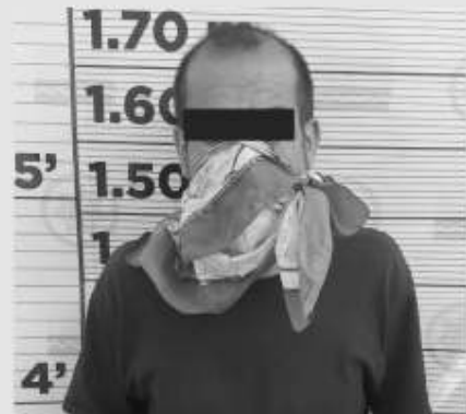
Alberto "N", de 42 años, fue detenido al intentar robar con violencia un vehículo.