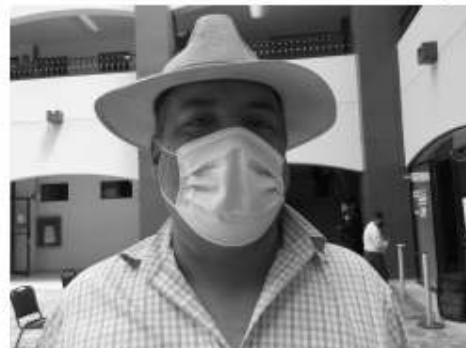
Víctor Hugo Chávez

La respuesta para la anuencia tarda entre dos a tres días aseguró, el