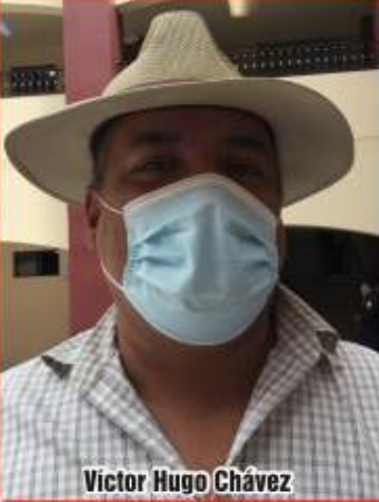
Victor Hugo Chávez

En espera de anuencia estatal doscientos negocios para su reapertura