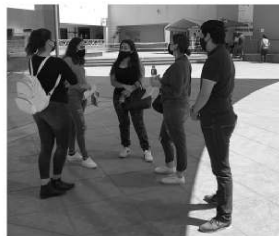
Ex empleados del casino M acudieron a recibir asesoría sobre su respectiva liquidación al módulo de la Secretaría del Trabajo del Gobierno del Estado.

Entre los incumplimientos que denunciaron está principalmente el pago completo de sueldos y los descuentos exagerados por un día de inasistencia.