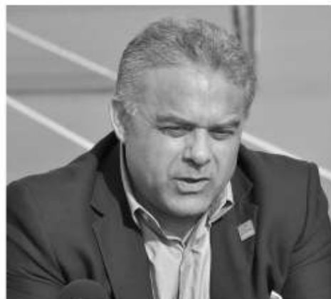
El Presidente del Consejo Consultivo de Desarrollo Económico Juan Santana Bosquet

El Presidente del Consejo Consultivo de Desarrollo Económico Juan Santana Bosquet consideró que la reactivación económica será mucho más difícil para aquellas empresas del