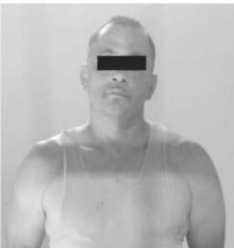
El ciudadano americano Raul N resultó con orden de aprehensión en EU.