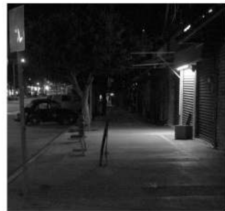
inseguridad y ordenar la activación de las luminarias de la zona turística.