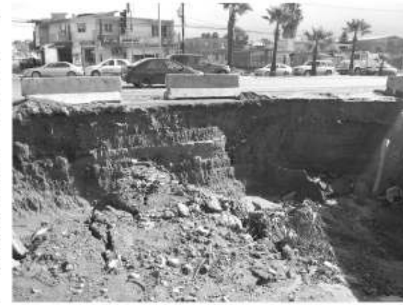
carretera libre a la altura Villas San Pedro y otro choque más pero sin lesionados de gravedad.

La Dirección de Bomberos reportó el incendio de un domicilio, aparentemente picadero, con pérdidas totales, además de una volcadura en la