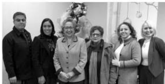
La Delegada del Gobierno del Estado Norma Gutiérrez organizó un brindis navideño en el que convocó a todos los delegados y representantes del sector productivo.

"Se quitó el hábito de poner vehículos en renta al exterior del edificio. Los ciudadanos solicitaban licencia sin