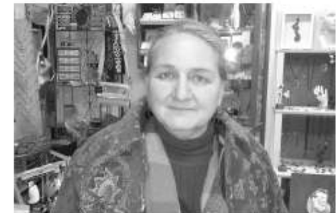
los llamados de la prensa para aclarar o definir su postura.