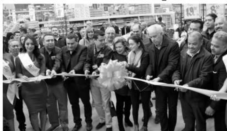
El corte de listón de la nueva tienda Aprecio en Rosarito, del grupo Calimax.