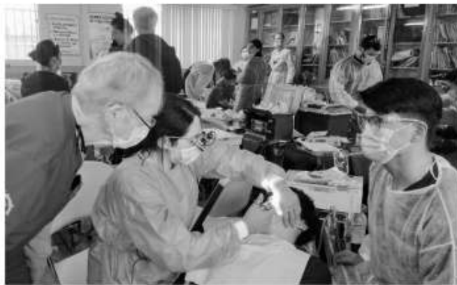
atención médica bucal a niños y adultos rosaritenses. Usando el equipo médico más moderno en atención

Más de 170 niños y adultos fueron atendidos en la jornada de salud bucal organizada por varios clubes rotarios con el apoyo de estudiantes de odontología de universidades de Estados Unidos, los días 14 y 15 de diciembre en la escuela Jesús García de la colonia Mazatlán. Una vez más la suma de esfuerzos entre los clubes rotarios de Playas de Rosarito, Rosarito, Newport Beach, Distrito 4100 y Distrito 5320, así como estudiantes voluntarios de Estados Unidos asesorados por profesores especialistas en la materia, llevó