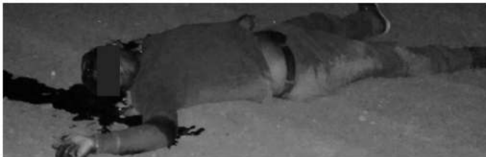
El hombre asesinado en Lomas Altas.