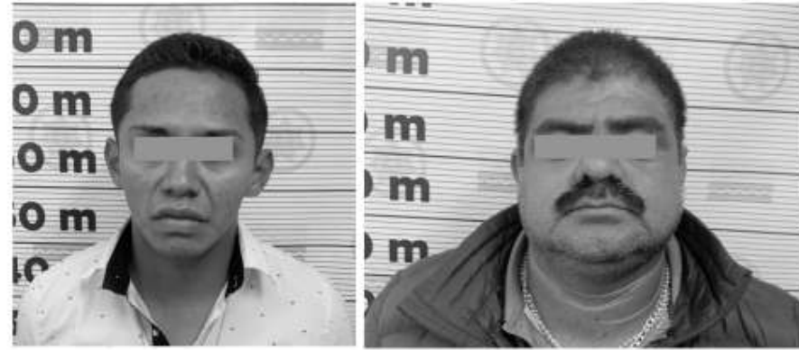
Estatal de Atención al Narcomenudeo en la ciudad de Tijuana.