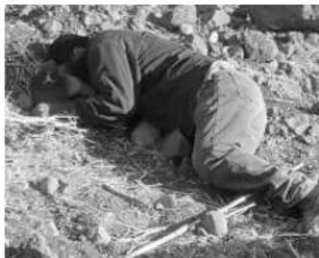
El hombre asesinado en la colonia Morelos.

solitario de la colonia Morelos, un hombre fue encontrado muerto.