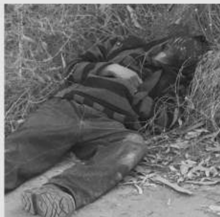
El hombre asesinado por el rumbo de El Descanso.