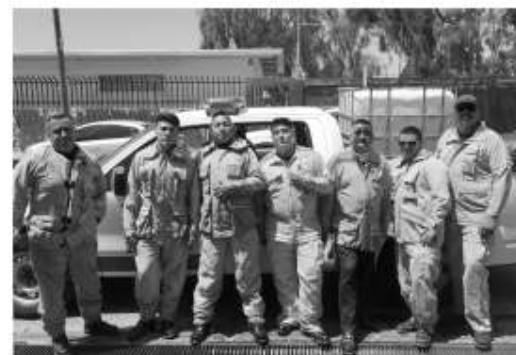
Dirección de Bomberos Municipales.

Durante la temporada de verano se han incrementado de cinco hasta 30 los reportes diarios sobre incendios de maleza en lotes baldíos y pastizales, lo cual es alarmante, ya que representa un incremento en insumos como diésel y agua, desgaste de unidades, equipo, material y personal para la