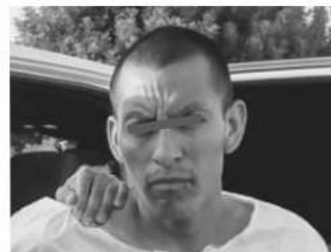
El sanguinario sujeto que asesinó a machetazos a un hombre.

Luego de ejecutar la orden de aprehensión, la Policía Ministerial puso al imputado a disposición del Juez de Control para la audiencia inicial.