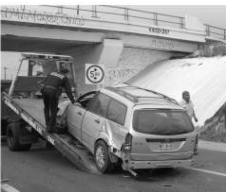
La camioneta quedó destrozada del cofre.