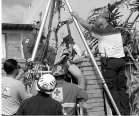
Paramédicos de la Cruz Roja rescata a hombre que quedó atorado en la reja de su casa, con una punta clavada en su pierna.

Paramédicos de la Cruz Roja llegaron al lugar y debido a lo complicado de la escena, utilizaron las quijadas de la