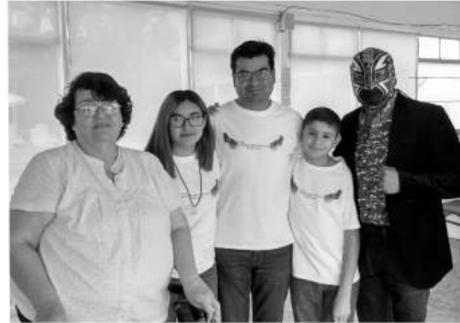
Invitan a función de box y kermes para apoyar a mujer que perdió su vivienda

"Nosotros somos residentes de la colonia Morelos, yo desde hace más de treinta años, el realizar eventos para apoyar a familias vulnerables surgió desde que somos parte del