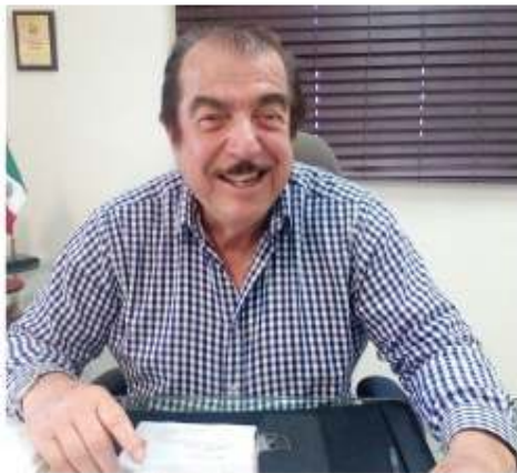
Síndico Procurador Miguel Ángel Vila Ruiz