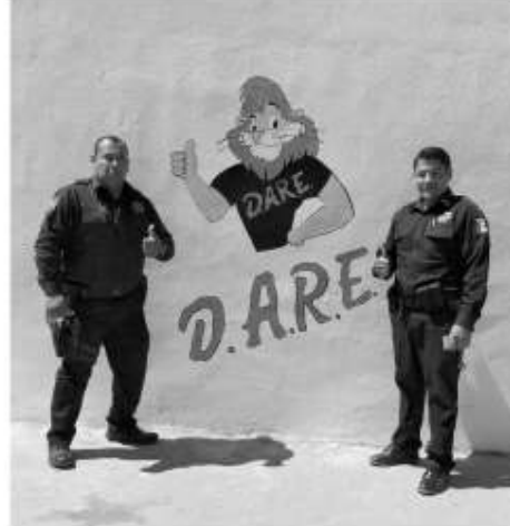
en las nuevas generaciones. El oficial encargado de realizar los

A pesar de que el ciclo escolar concluyó, los programas preventivos continuarán, pues los oficiales encargados de impartir el curso realizarán a cabo estos murales con el apoyo del Patronato Dare, con el fin de fomentar la cultura de la prevención y evitar conductas antisociales y de ocio