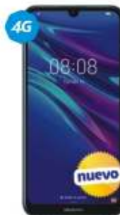
Huawei Y6 2019 VOZ HD FINGER PRINT $3,789