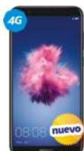
Huawei P Smart 2019 VOZ HD FINGER PRINT $4,689