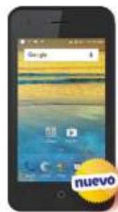
ZTE L130 $1,099