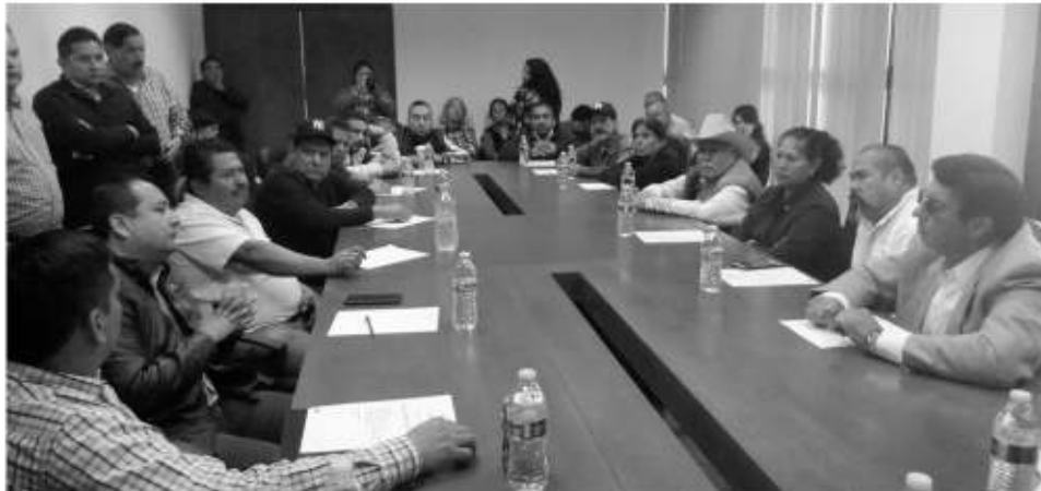
Vecinos, líderes transportistas y regidores analizan fortalecer la ruta Aztlán-Caracoles.

El representante de la empresa V Municipio aseguró que la ruta opera desde hace tiempo con un itinerario de 55 corridas diarias a partir de las 6 de la mañana, una calafia cada media hora. Pese a ser una ruta no rentable por la escasa población, el trayecto extremadamente largo y lo distante que están unos fraccionamientos con otros a lo largo de la misma, se mantiene gracias a los choferes, quienes