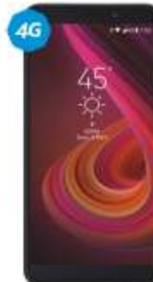
Lanix M9 VOZ HD FINGER PRINT $1,959