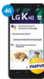
LG K40 VOZ HD FINGER PRINT $3,999