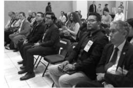
Preescolar Carmen Serdán participaron con la Escolta de Bandera y con su Banda de Guerra.

Durante el acto protocolario alumnos del