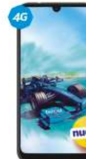
ZTE V10 Vita VOZ HD $2,919