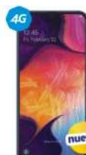
Samsung Galaxy A50 VOZ HD FINGER PRINT $7,999