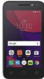
Alcatel 4034G U3 GL $1,239