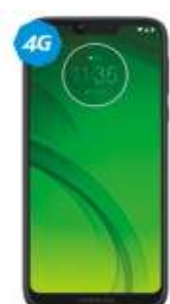
Motorola G7 Power VOZ HD FINGER PRINT $4,999