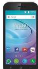
ZTE L7A $1,399