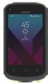
Lanix X120C $1,079