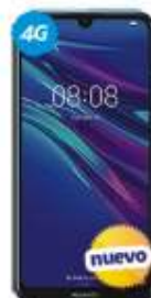
Huawei Y6 2019 $3,789