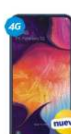
Samsung Galaxy A50 $7,999