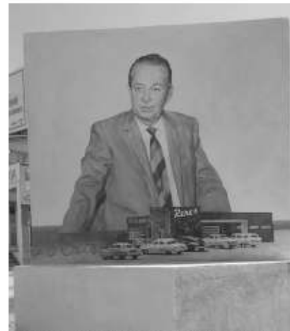
El mural robado tenía un valor aproximado de 60 mil pesos.