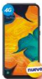
Samsung A20 $4,499