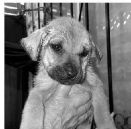
Facebook, Santuario-Esperanza o bien comunicarse al teléfono 100 24 52.