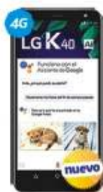
LG K40 $3,999