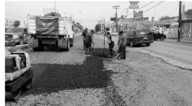
Villas de Siboney y Colinas de Rosarito.

Así también el mejoramiento de vialidades también implica el mantenimiento de caminos de terracería como en comunidades apartadas, como se llevó a cabo en días pasados en