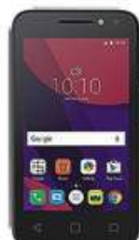
Alcatel 4034G U3 GL $1,239