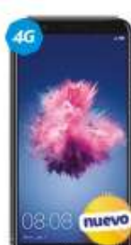
Huawei P Smart 2019 $4,689