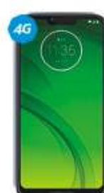
Motorola G7 Power $4,999