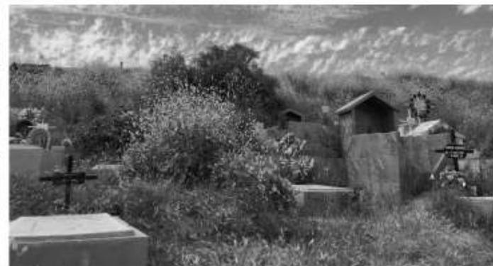
como víboras de cascabel, que circulan entre la maleza y las tumbas.

Además de la falta de limpieza, saqueo de artículos en las tumbas por delincuentes, los visitantes tienen que lidiar con fauna endémica de la región,