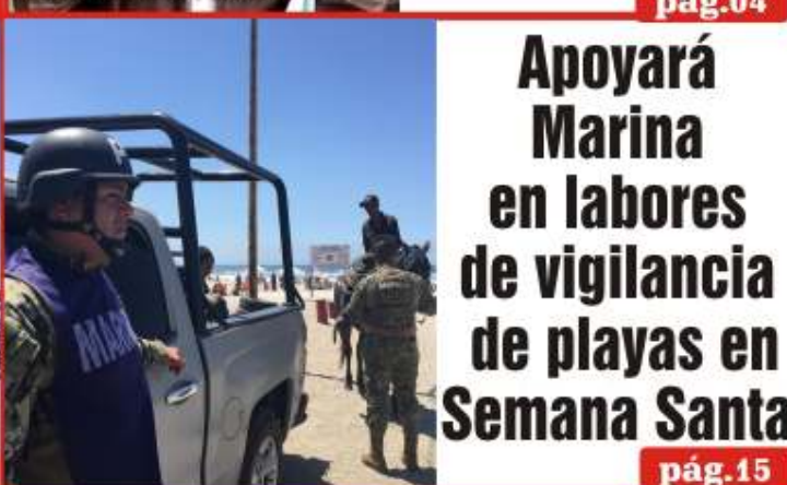
Apoyará Marina en labores de vigilancia de playas en Semana Santa pág.15