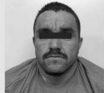
Santiago N fue enviado a prisión preventiva acusado de robo con violencia.

Luego de las investigaciones de la Policía Ministerial, se logró ubicar al responsable y ponerlo bajo proceso judicial, con la respectiva orden a