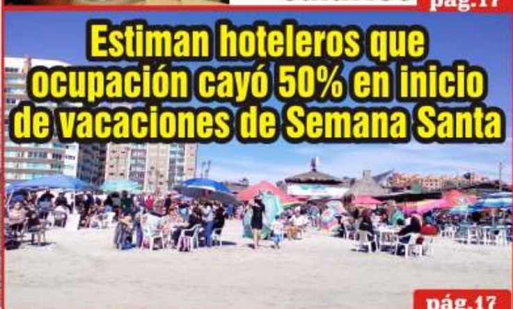
Estiman hoteleros que ocupación cayó 50% en inicio de vacaciones de Semana Santa pág.17