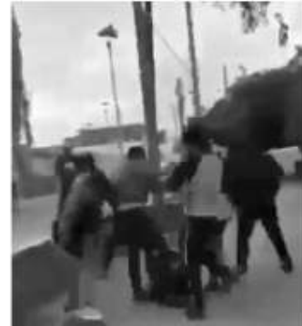
Tijuana por el delito de lesiones, según informaron autoridades municipales.

dejar de golpearlos. Ambas víctimas fueron pateadas en repetidas ocasiones en diferentes partes del cuerpo, hasta que finalmente deciden dejarlos en paz. Elementos de la Policía Turística llegaron al lugar y lograron detener a siete de los presuntos responsables. Los siete detenidos fueron turnados al Ministerio Público especializado en menores de la PGJE en