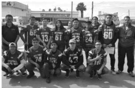
El equipo de fútbol americano del Cobach Primer Ayuntamiento Delfines.

sólo un equipo de fútbol americano, sino un programa integral donde haya una colaboración con las universidades del sureste del país para que los muchachos puedan adquirir una beca para irse a estudiar a escuelas de prestigio.