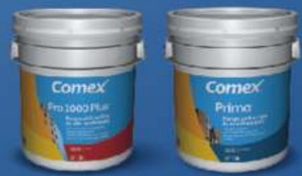
cubeta 19 litros

Elige entre mate y satinado, al mismo precio