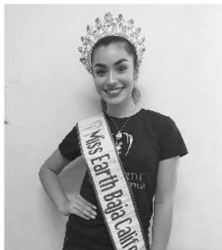
viable para cualquier región de México.

Durante el certamen nacional se calificará la belleza integral, inteligencia, seguridad, elegancia y porte que poseen las candidatas al título. Además candidatas presentarán un proyecto ecológico que debe ser