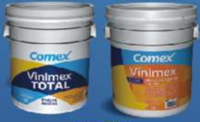
cubeta 19 litros

"Con Vinimex tú eliges cuál quieres por el mismo precio"