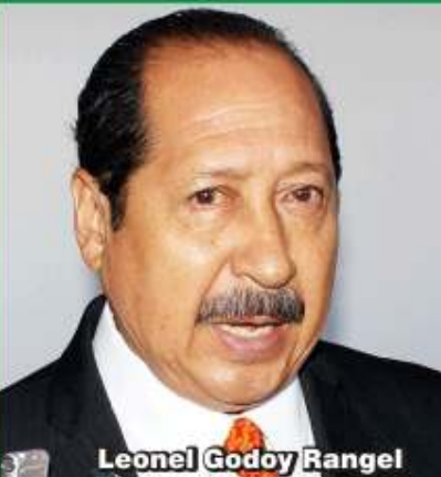
Leonel Godoy Rangel

Que Kiko no meta las manos en las elecciones: Godoy