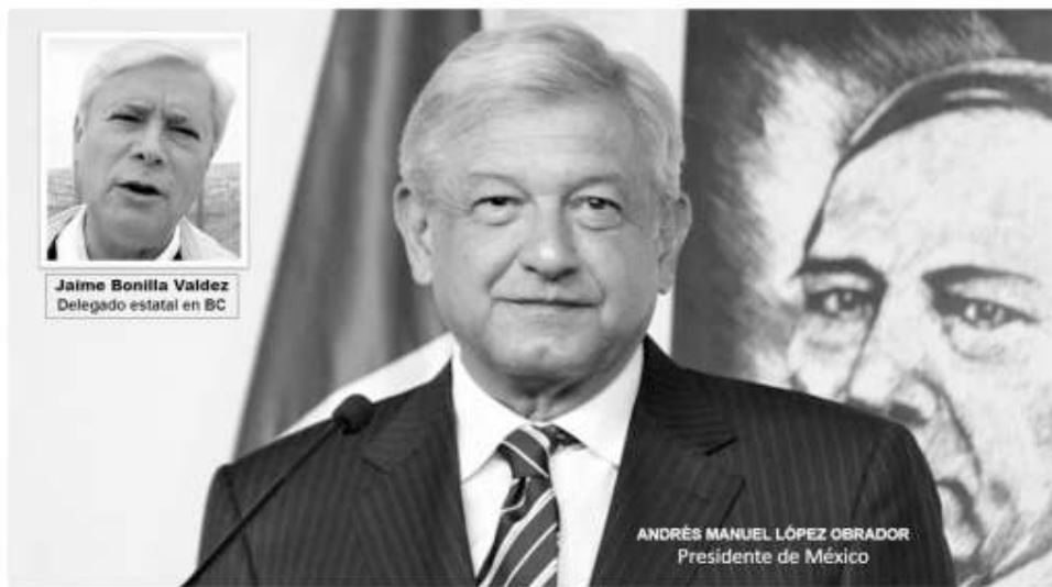
Jaime Bonilla Valdez Delegado estatal en BC