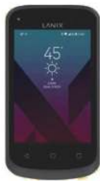
Lanix X120C $999