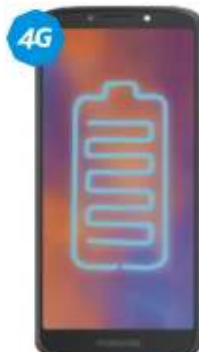
Motorola ES VOZ HD FINGER PRINT $2,999