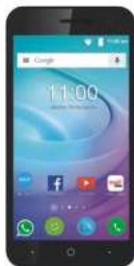
ZTE Blade L7A $1,589