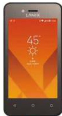
Lanix X230 $1,239