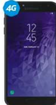
Samsung J6+ VOZ HD $4,999

Activa con $50 y obtén el TRIPLE en tu paquete la primera vez con 28 días de servicio