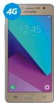
Samsung Grand Prime+16GB $2,499