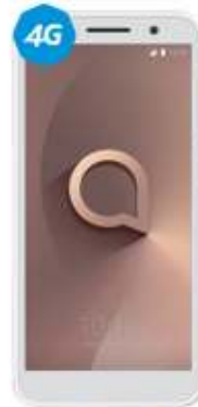
Alcatel 5033A $1,499

En la compra de un Amigo Kit llévate de regalo UN Renato (4 modelos) 5 Consulta marcas participantes