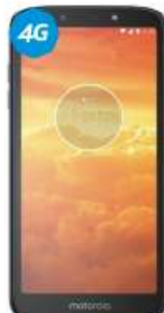
Motorola ES Play $2,399