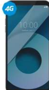
LG Q6 Prime VOZ HD $4,499