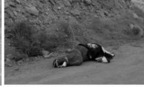
El hombre encobijado en un camino de terracería cerca de las albercas El Palmar.

El siguiente hecho se registró la mañana del lunes 5 de noviembre, sobre un camino vecinal en la calle Mar Negro y privada Rancho del Mar cerca del Centro de