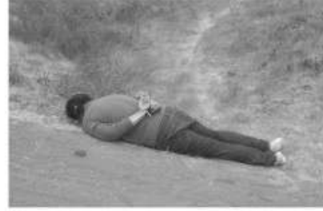
El hombre encontrado muerto por el rumbo del Centro de Convenciones estaba maniatado.

En ese lugar fue hallado el cuerpo de un hombre envuelto en un cobertor y con la cabeza cubierta con una bolsa de plástico.