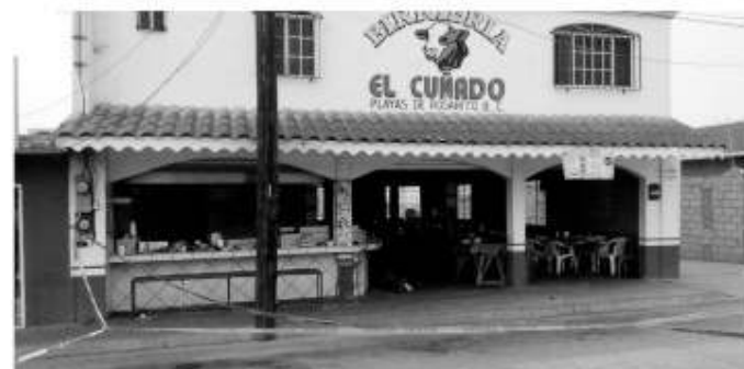
El cuerpo quedó tendido en el interior de la taquería Los Cuñados.

La restricción a la circulación de vehículos generó un intenso tráfico en el carril de norte a sur que se prolongó durante varias horas, provocando molestias de automovilistas por lo que consideraron un innecesario