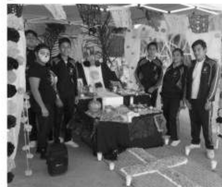
los grupos del tercer grados.