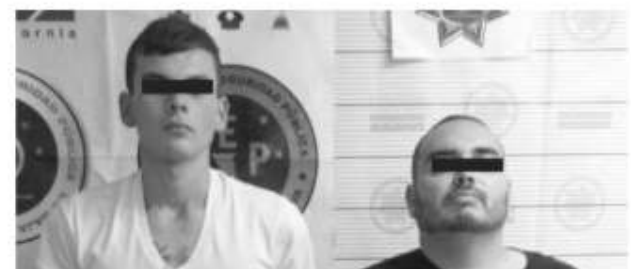
Los sujetos detenidos con armas de fuego en el casino Rene's.

El aseguramiento se efectuó tras atender un reporte en el cual se mencionó que dos sujetos armados habían protagonizado una riña suscitada momentos antes sobre el bulevar