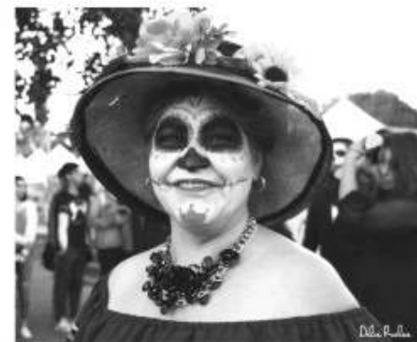
un bailable tradicional de Janitzio, entre otros grupos más.

Así también se tuvo la participación de niños y jóvenes integrantes del grupo de baile "Xanicha" de la comunidad purépecha sentada en el municipio, con