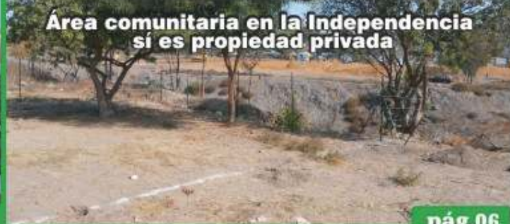
Area comunitaria en la Independencia si es propiedad privada

Se apropia particular de áreas comunitarias en la colonia Independencia