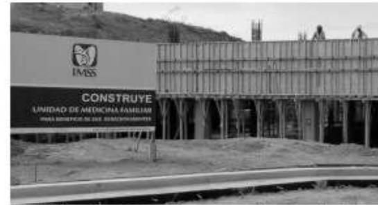
Más de 200 mil pesos robaron de la obra de la nueva clínica del IMSS.

Pese a esta enorme pérdida económica de la empresa constructora, los trabajos