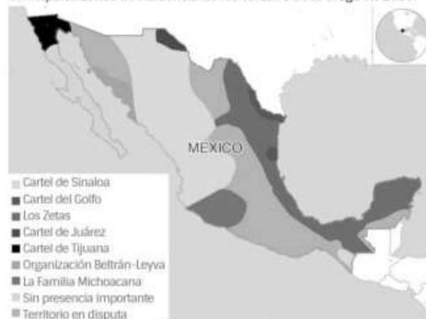
Principales zonas de influencia de los cárteles de la droga en 2010

tras la captura y extradición de Joaquín Guzmán Loera, "El Chapo", a quien dentro de su organización le llamaban también "El General".