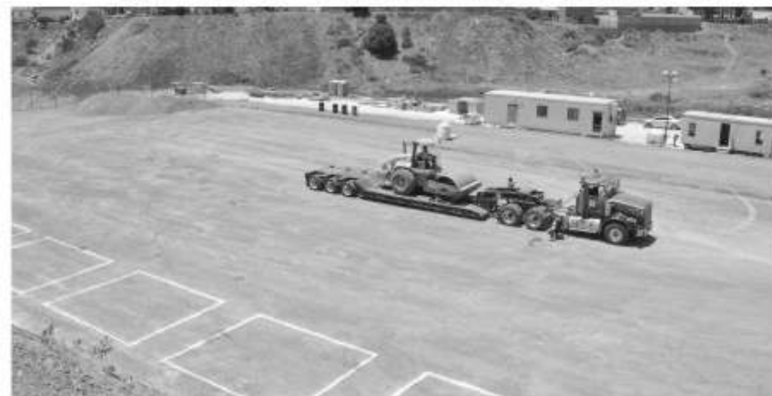
En este predio de la colonia Lomas de Coronado se construirá la nueva clínica del IMSS.