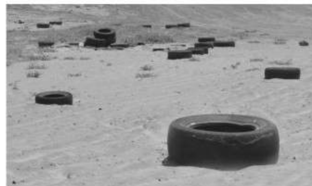
Decenas de llantas esparcidas en la playa dejaron los organizadores del evento de exhibición de carros junto a Quintas del Mar.

a dormir. Es mucho más trabajo para nosotros porque muchas llantas no están en la playa, sino en predios cercanos", sostuvo un vigilante de la playa. Exhortó a los visitantes y a las autoridades locales para que ejerzan mayor control de los eventos que particulares realizan en Rosarito y se garantice que dejarán limpias sus áreas de trabajo.