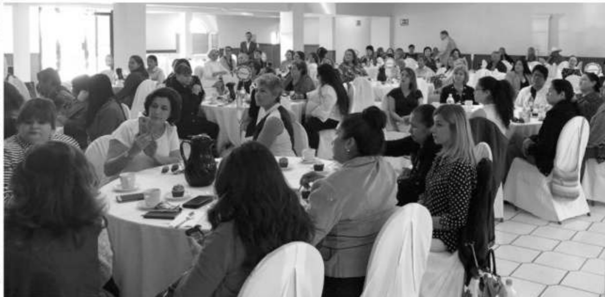
Más de 100 mujeres asistieron a la conferencia organizada por la ex diputada Laura Torres.