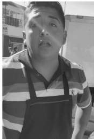
El comerciante agresivo.