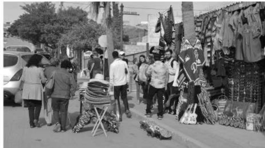
Las banquetas invadidas en Puerto Nuevo.

ambulantes que invaden las aceras y las calles, así como los drogadictos y los jaladores que hacen de las suyas con los turistas.