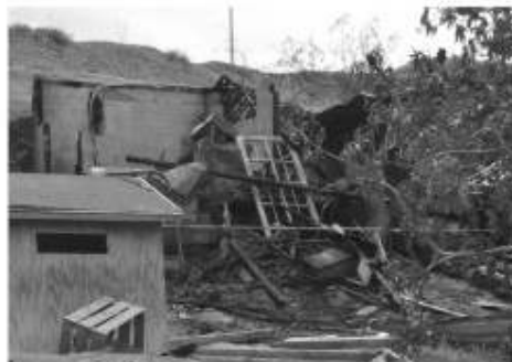
El cuerpo del joven quedó calcinado entre los restos de esta humilde casa de madera.

comenzó cuando escucharon una fuerte explosión y vieron las llamas consumir rápidamente la vivienda de madera.