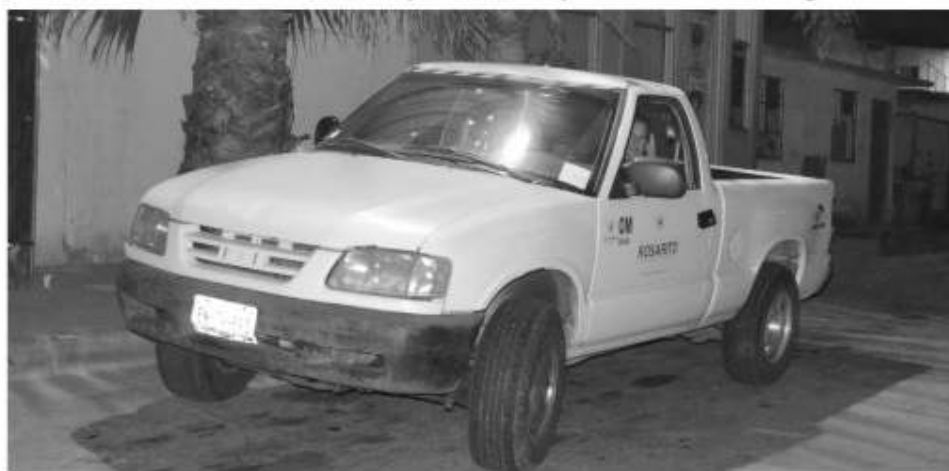
La Sindicatura Municipal vigila permanente el área de resguardo de vehículos de grúas Salceda.

·Sindicatura instala supervisión permanente en grúas